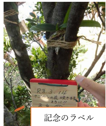
記念のラベル を設置