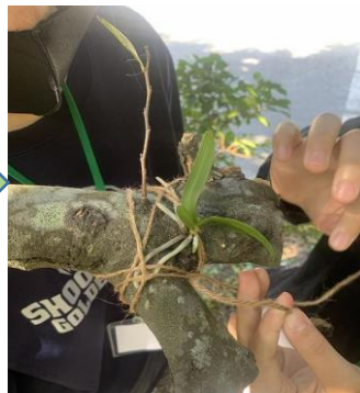
根を広げて 枝にくくりつける