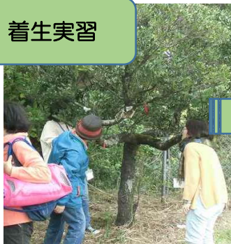
着生する樹木・場所 を選ぶ