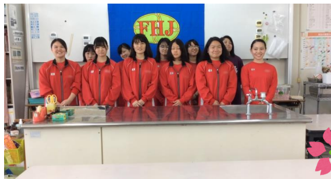
家庭クラブの会長・副会長と3年生の役員のメンバーです。