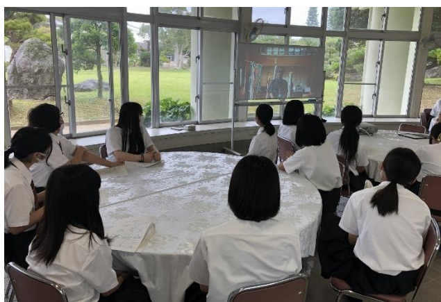
1年生が校長先生のあいさつを聞いている様子です。