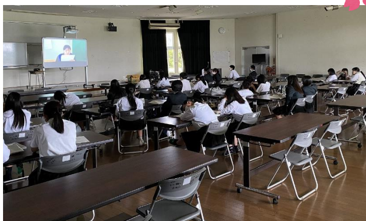
2年生が1年生の代表者のあいさつを聞いている様子です。