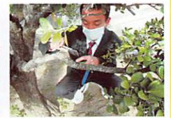
ナゴラン生育調査