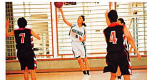
女子バスケット部