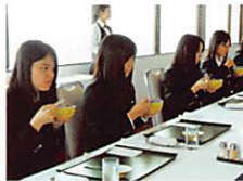
テーブルマナー講座