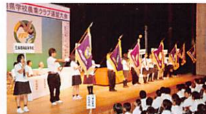
九州学校農業クラブ連盟大会

北農伝統のレスリング部や相撲部、空手道部、柔道部、ソフトテニス部、バレーボール部、バスケットボール部、野球部、サッカー部など多くの部活動、同好会が活動しています。生物研究部や放送部などの文化系部活動も活発です。