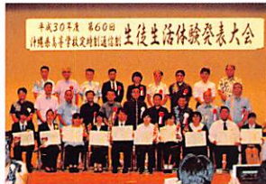
生徒生活体験発表大会