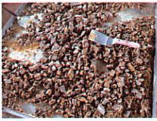
オリジナル純黒糖