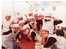
マグロレシビ選手権