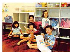
絵本の読み聞かせ