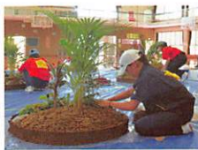
室内園芸装飾技能検定