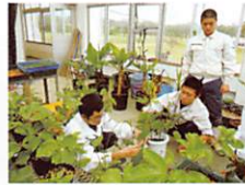
パッション苗の生産