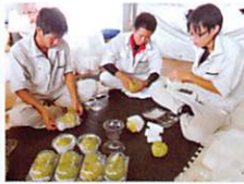
アテモヤの出荷調整