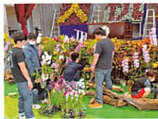
卒業式の装飾制作