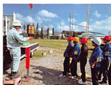
移動式クレーン講習